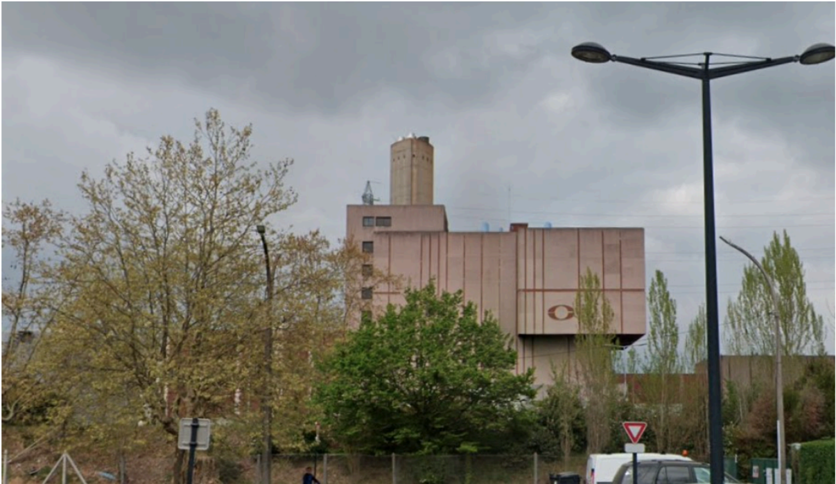
Vue depuis la rue André Gide