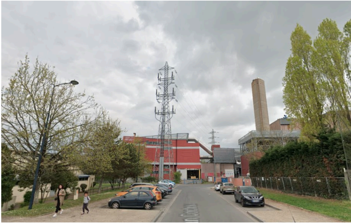
Vue depuis la rue Jean Cocteau