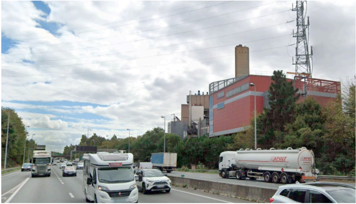
Vue depuis la rocade sortie 25