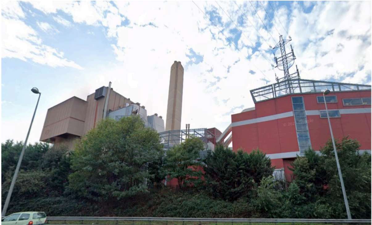
Vue depuis la rocade