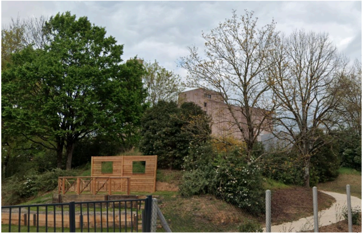
Vue depuis la rue Paul Verlaine