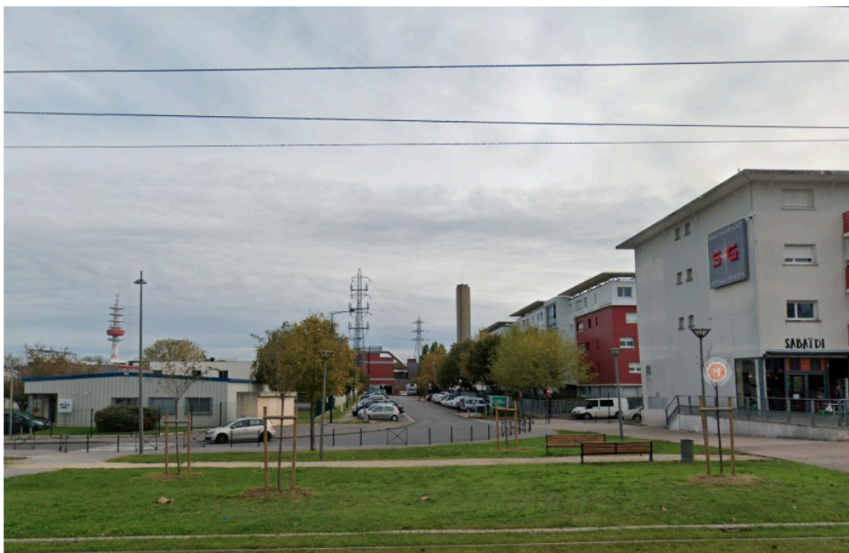
Vue depuis l'avenue Georges Clémenceau