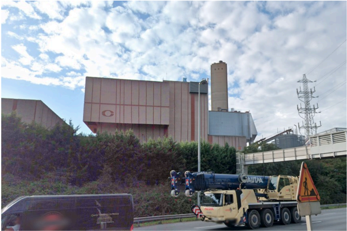
Vue depuis la rocade